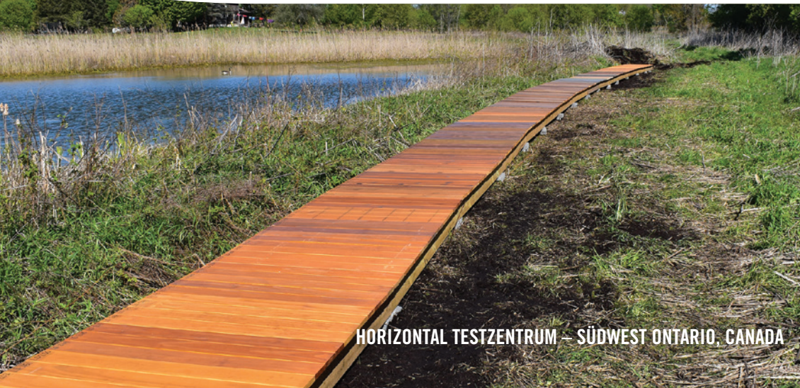
HORIZONTAL TESTZENTRUM – SÜDWEST ONTARIO, CANADA