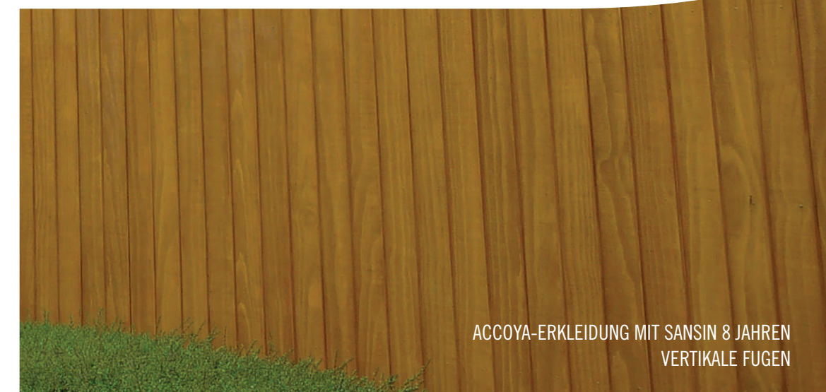
ACCOYA-ERKLEIDUNG MIT SANSIN 8 JAHREN VERTIKALE FUGEN