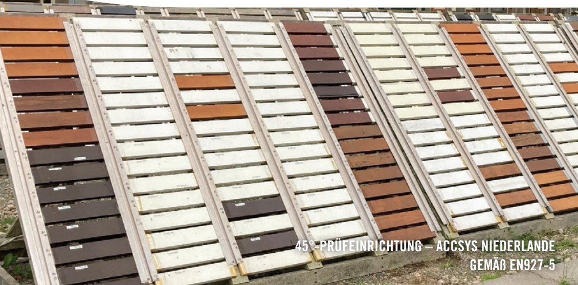
45° PRÜFEINRICHTUNG – ACCSYS NIEDERLANDE GEMÄß EN927-5